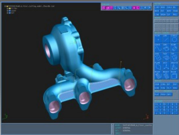
TEBIS CAD / CAM V3.5 R3 (Flächenkonstruktion / CAM)